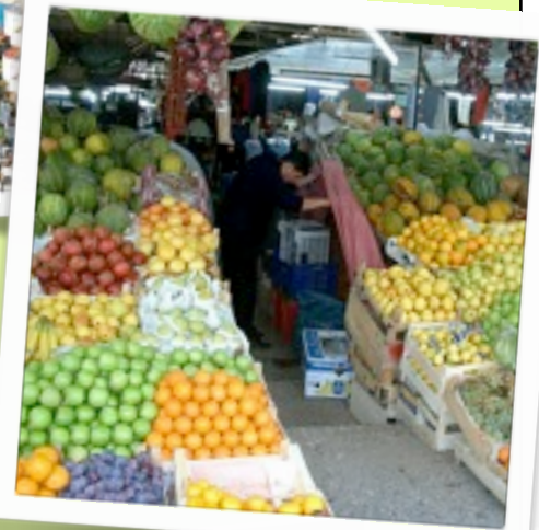
Reichhaltige Auswahl an Früchten auf dem Basar von Antalya